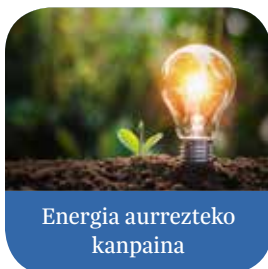
Energia aurrezteko kanpaina