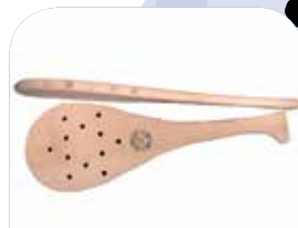
Urrezko Pala-pro txapelketa