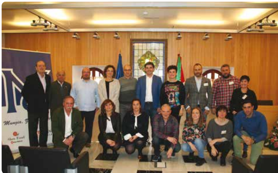
Udal-korporazioa / Corporación Municipal