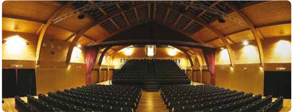
Olalden egingo diran proiektzioen kopurua txikiagoa izateak ez dau ikusleentzat ezelango kalterik ekarriko, izan ere, Olalde Aretora Torrebillak baino asko handiagoa da, halako hiru hain zuzen bere.

Horretara, urtarriletik aurrera, zinema komertzialaren proiektzioek bat egingo dabe Olalden antzerki, dantza eta musika programazioagaz. Diziiplina ezberdinen arteko alkarbizitza ona lortzeko, asteburuan modurik orekatuenean banatuko dira bateko eta beste saioak. Hau da, zapatuetan antzerki, dantza eta musika ikuskizunak eskainiko dira eta zinea, barriz, bariku eta domeketan emongo da. Astelehenetan bere eskainiko da saio bat, eta gehin-gehienetan helduentzat izango