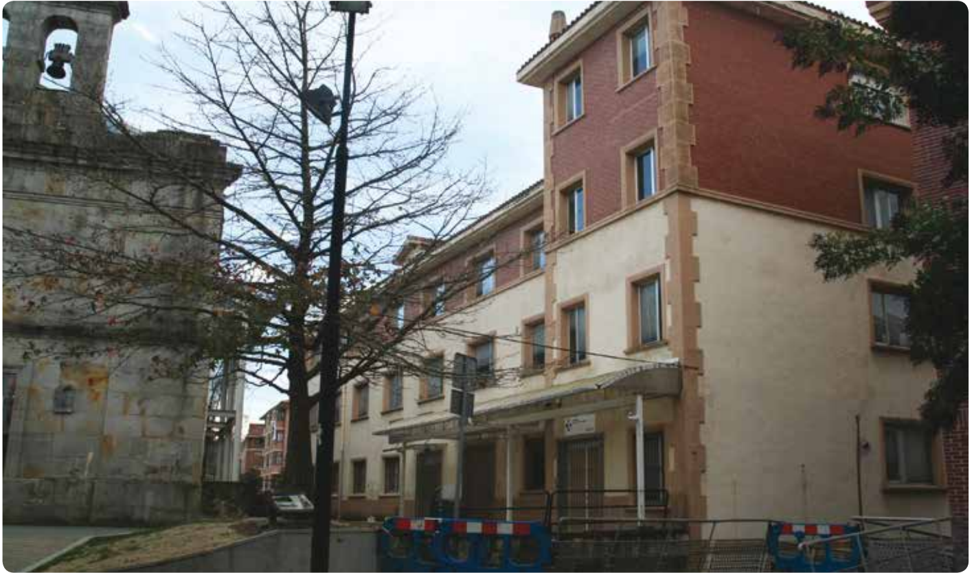
Anbulatorio zaharrean jarriko diren zerbitzuek ekipamendu hobea izango dute.