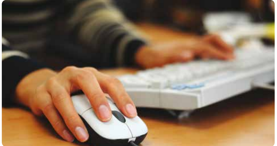
Mungiarrek erosoago eta errazago egin ahal izango dabez tramiteak.

Desde el Consistorio llevamos meses trabajando en este propósito para actualizar todas las aplicaciones de gestión interna del Ayuntamiento. Asimismo, ya se ha llevado a cabo alrededor de la mitad del proyecto trabajando sobre los sectores de Padrón y Registro, definiendo los procesos y procedimientos para que vecinos y vecinas puedan acceder a éstos. En este año que entramos, el trabajo irá dirigido a las áreas de Expedientes y Contabilidad.