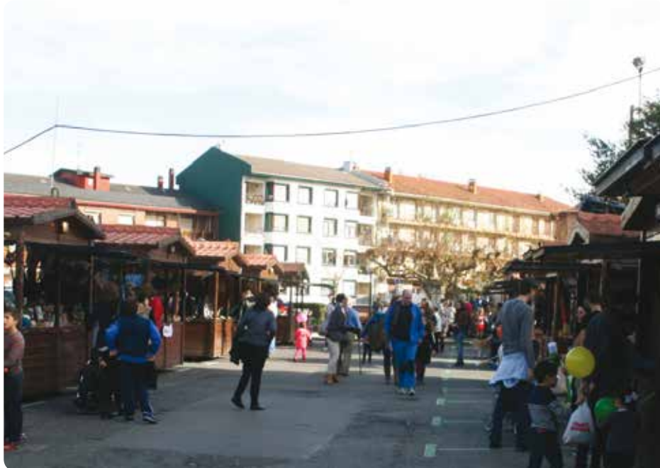
Gabonetako erosketak azokan egiteko aukerea aprobetxatu dabe mungiar askok.

Umeak alaitu eta liluratzeko postuak bere egon dira: Plisti Plaust eta Galtzagorri , hain zuzen bere. Eta zelan ez, gozokiak saltzen