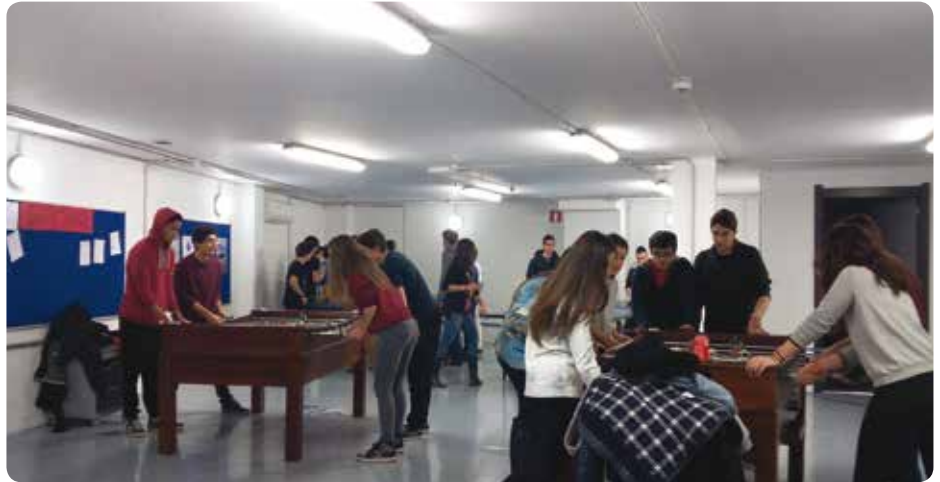
Gazteguneak ping-pong eta mahai-futbol txapelketak, karaokea, bideoklip zein kirol-bideoen emankizunak eta mahai-jokoak izan ditu, besteak beste, abiapuntu azken hamabi hilabeteotan.

Gazteentzako interesgarriak diran hitzaldiak bere egin dira, adibidez, interrail-en ganekoa eta European lan egin eta ikasteko aholkuen ingurukoa.