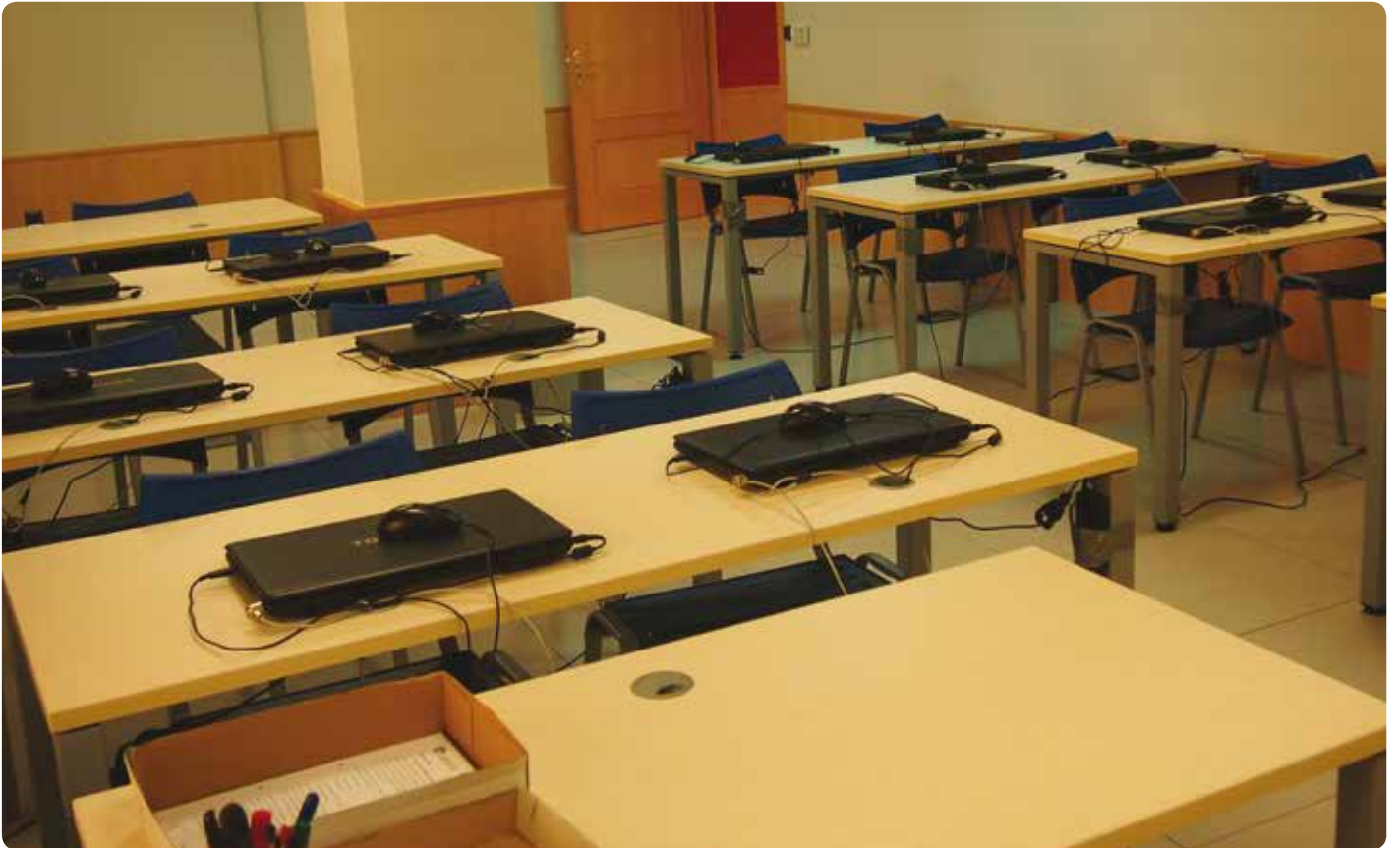
El equipamiento está dotado de aulas más espaciosas y acondicionadas para ofrecer mejores prestaciones.

Tras el traslado de Jata-Ondo a la calle Trobika, y aprovechando el hueco dejado por la asociación, se han realizado una serie de reformas en sus instalaciones mediante las que se ha mejorado la accesibilidad de las personas, así como mejorar la infraestructura de locales y equipamientos para prestar, de forma individualizada o grupal, las acciones y servicios de orientación para el empleo.