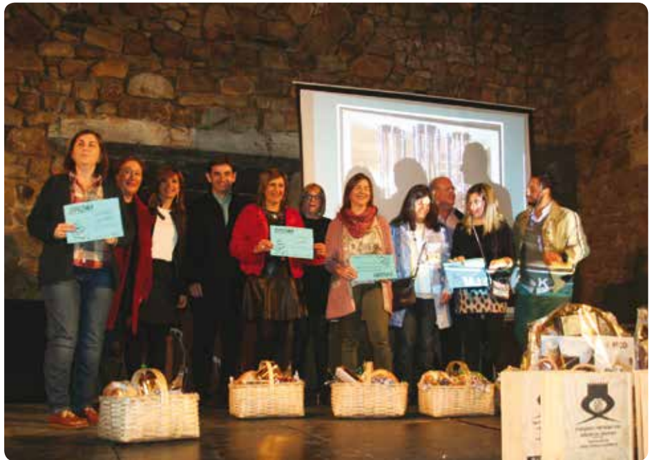
Merkataritza Galako lehiaketaren irabazleak, Mungiako Merkatari eta Ostalari elkarteko, Udaleko eta Mungialdeko Behargintzako ordezkariekin batera

Bestalde, Merkatari eta Ostalarien Elkartearen komertzioetan erosketak egin ebezan bezeroen artean 500 euroko hiru txeke eta