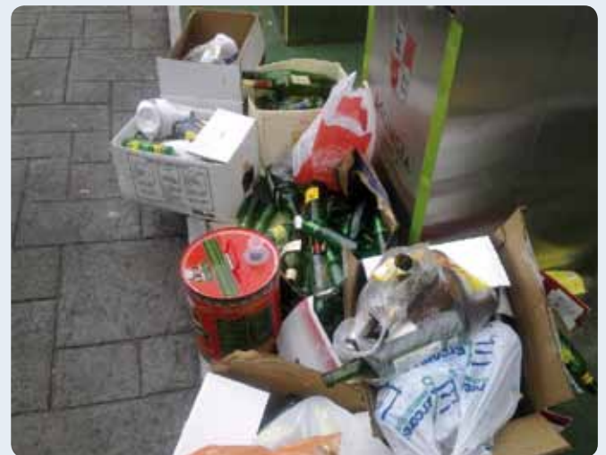
Kristalezko botilak edozein zabor-educiontziren inguruan pilotuta; jakinda, ganera, hori arriskutsua izan leitekeala ume zein nagusientzat.

Colchones, muebles, carros y objetos de lo más variopintos depositados en plena vía pública. Esto ocurre sobre todo los fines de semana.