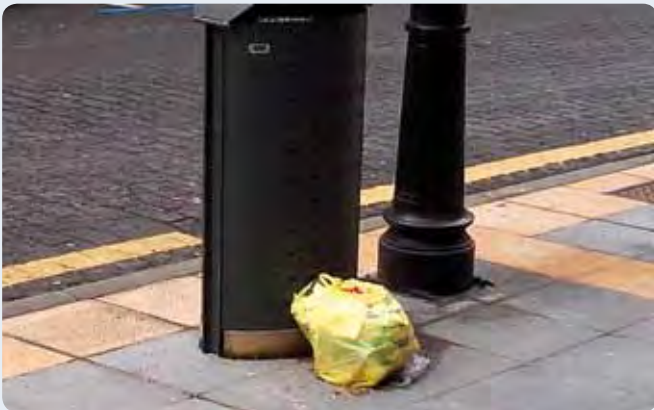
Paperontzien ondoan zabor-bolsak botata, ia egunero.

Cajas de cartón que, por no tomarse la molestia de recortar o de doblar para introducirlas en el contenedor correspondiente, se apilan en su exterior, dejando ese trabajo para las personas trabajadoras de la limpieza.