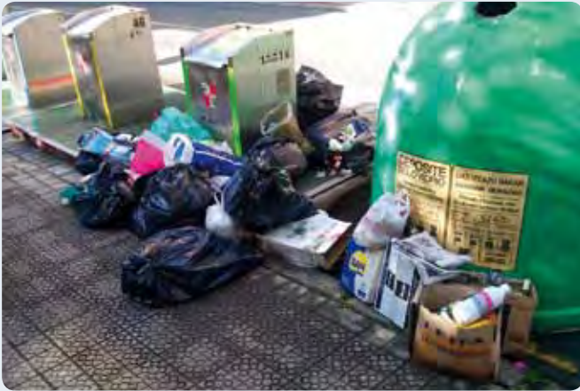
Zabor-bolsak bata bestearen ganean, edukiontzietatik kanpo. Garbiketa-zerbitzuko arduradunen arabera, askotan ganera, edukiontzioak hutsik egoten dira.

Bolsas de basura almacenadas, en muchas ocasiones, fuera de los correspondientes contenedores cuando, curiosamente, según se señala desde el servicio de limpieza, éstos están, muchas veces, vacíos.