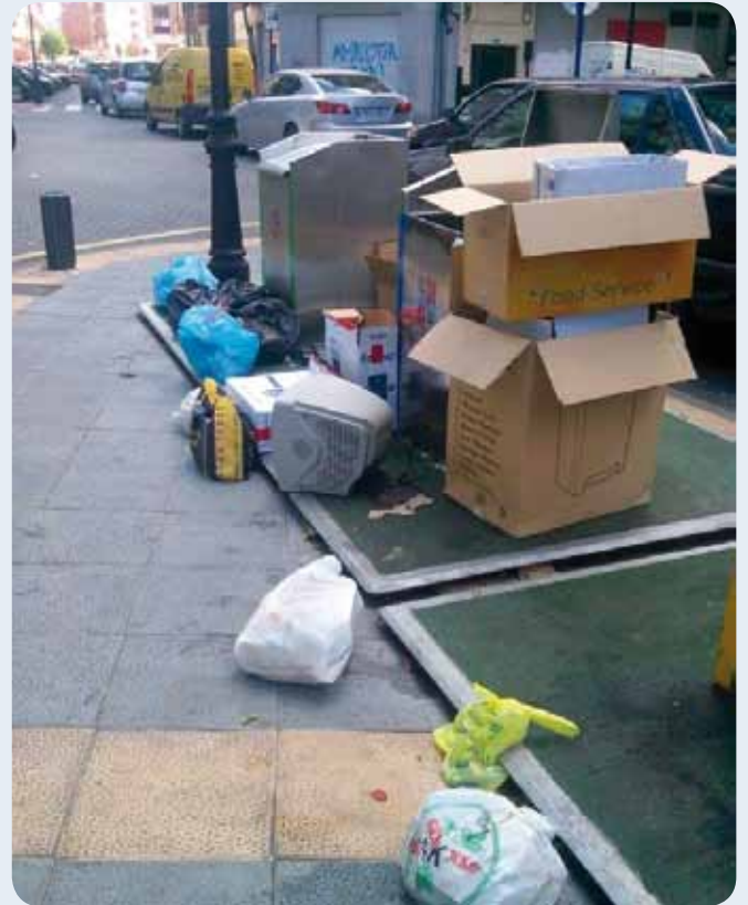
Kartoizko kajak, osorik eta bata bestearen ganean zabor-educiontzietatik kanpo, norberak zatitu edo tolestu barik, garbiketa-zerbitzuarentzat itxita.

Bolsas de basura almacenadas, en muchas ocasiones, fuera de los correspondientes contenedores cuando, curiosamente, según se señala desde el servicio de limpieza, éstos están, muchas veces, vacíos.