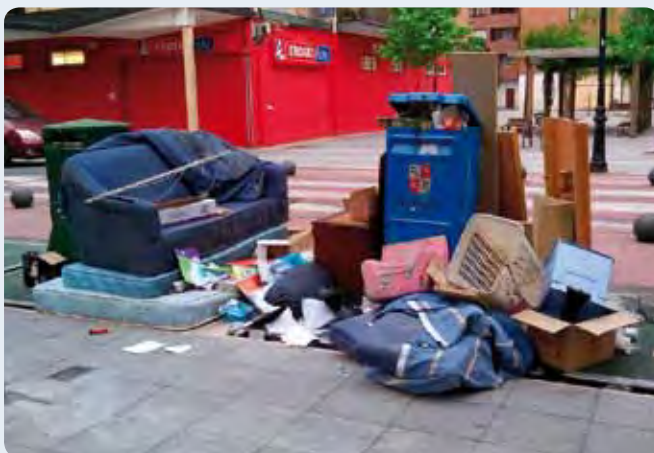
Koltxoiak, altzariak, karroak eta danetariko objektuak kale erdian itxita. Holangoak asteburu guztietan ikusten dira.

Bolsas de basura depositadas junto a papeleras, día sí y día también.